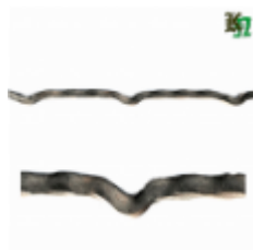
Квадрат для решетки, обжатый, арт. 178 1900мм, кв.12x12мм Вес: 2.14 кг нет в наличии