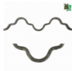
Монастырская вязь, обжатая, арт. 181 1560мм, кв.12x12мм Вес: 2.2 кг нет в наличии