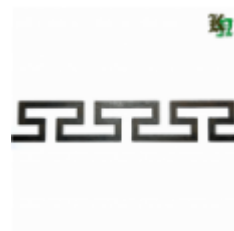
Декоративный прокат, полоса, арт. 823 1200х80х2,5мм Вес: 1.2 кг Цена (за штуку): 460 руб.