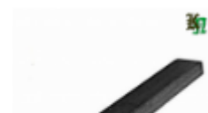
Полоса, арт. 12601П 3000x12x6мм Вес: 1.7 кг Цена (за штуку): 250 руб.