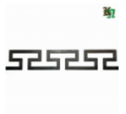
Декоративный прокат, полоса, арт. 824 1200х95х2,5мм Вес: 1.2 кг Цена (за штуку): 490 руб.