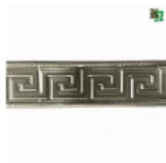
Декоративный прокат, полоса, арт. 412.26 2500х80х1мм Вес: 1.37 кг Цена (за штуку): 650 руб.