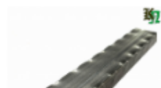
Труба профильная, арт. 40202T 3000x40x20мм Вес: 3.9 кг Цена (за штуку): 600 руб.