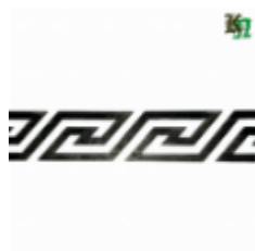
Декоративный прокат, полоса, арт. 820 1200х95х2.5мм Вес: 1.2 кг Цена (за штуку): 480 руб.