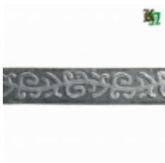
Полоса, арт. 20404П 3000x20x4мм Вес: 2.17 кг нет в наличии