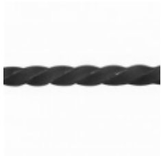
Квадрат, арт. 12Д4 3000мм, кв.12х12мм Вес: 3.45 кг Цена (за штуку): 680 руб.