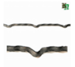
Квадрат для решетки, обжатый, арт. 179 1900мм, кв.10х10мм Вес: 1.5 кг Цена (за штуку): 350 руб.