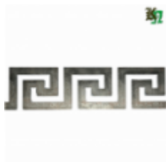
Декоративный прокат, полоса, арт. 827 1200x95x2мм Вес: 1.2 кг Цена (за штуку): 550 руб.