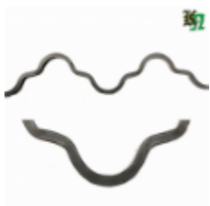
Монастырская вязь, арт. 180 1650мм, кв.12х12мм Вес: 2.26 кг Цена (за штуку): 450 руб.